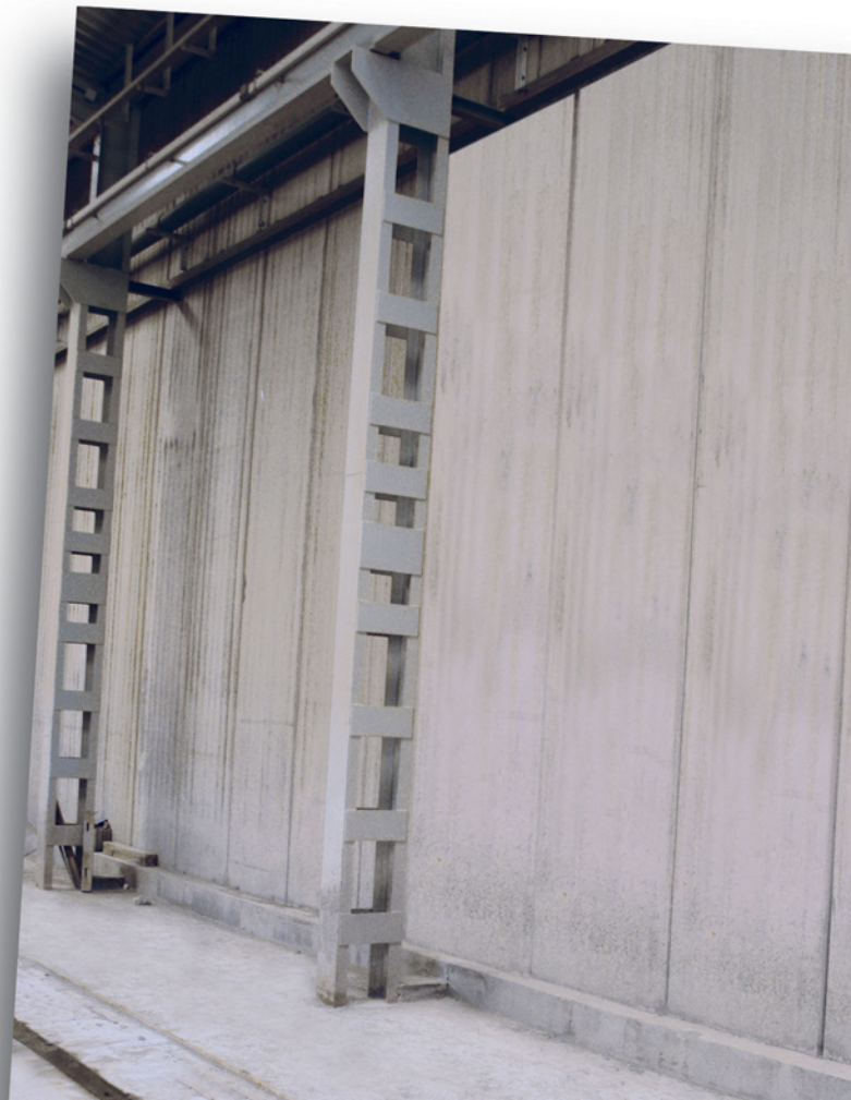
Muro de contención